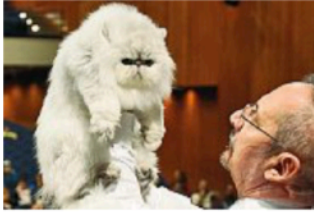
Passione Uno dei mici esposti alla Gran Guardia