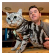
Un British Short