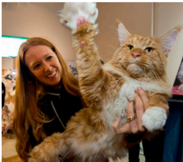
Un gatto Main Coon, una specie che può arrivare a pesare 16 chili.

E il gatto più costoso e di pregio? «Non c'è una razza specifica che è ritenuta più di valore di altre, perché dipende molto dall'allevamento e dalla genealogia, ossia da quanto sia blu il suo sangue», spiega l'organizzatrice. «Chi compra un gatto già campione per la riproduzione può sborsare fino a 5mila euro, ma tendenzialmente quelli da appartamento non superano i mille euro». •