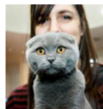
Uno Scottish Fold