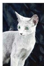
La gatta Ginette

Dopo tre anni d'assenza, dovuti alla pandemia, torna negli spazi della Fiera l'esposizione internazionale felina dell'Eni (Ente Nazionale Felinotecnica Italiana) "I Gatti più belli del mondo". Due giornate, il 14 e 15 gennaio, interamente dedicate a uno degli animali domestici più amati, che saranno anticipate dal contest natalizio per i mici di casa e il biglietto regalo da mettere sotto l'albero (previdente già aperte su gattipiubellidelmondo.it ). Sulle pagine Facebook e Instagram della manifestazione