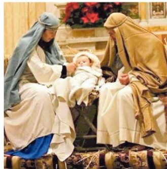
Una precedente edizione del presepe vivente di Codevigo

Ci sono tanti modi per ricordare la Natività, per raccontare i protagonisti e la vicenda che cambiò la storia e che si festeggia il 25 dicembre con l'arrivo di Gesù. La grotta, il bue e l'asinello, Maria e Giuseppe che proteggono la culla, poi i pastori e i Magi che diventano testimoni, sono le figure che si rivedono nella scena della Natività che ogni anno fa il giro del mondo in tanti modi diversi. Dalle rappresentazioni artigianali, che si ritrovano nelle parrocchie della provincia, a quelle "viventi", dove i protagonisti della notte dell'arrivo del bambino diventano i personaggi di piccoli set teatrali, che vengono ricreati a più riprese. Segue i passi di San Fran-