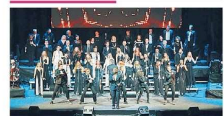
GRAN TEATRO GEOX

MULTISALA HESPERIA Via S. Pio, 2 0429-722084 Avatar: La Via dell'Acqua 17.30-21.15 Il Gatto con gli Stivali 2 - L'Ultimo Desiderio 17.30 Il Grande Giorno 18.30-21.30 TORRIDI QUARTESOLO THE SPACE CINEMA LE PIRAMIDI Via Bescia Avatar: La Via dell'Acqua 14.15-15.50-18.50-17.50-18.20-20.00-21.00-22.30 Ernest e Celestine L'avventura delle 7 note 11.20-13.20 Il Grande Giorno 14.20-15.20-18.10-21.20 Lo schiaccianoci e il flauto magico 11.20 Whitney: Una Voce Diventata Leggenda 14.20-22.10 Avatar - La via dell'acqua 3D 18.20-17.20-20.30-21.30 Il Gatto con gli Stivali 2 - L'Ultimo Desiderio 14.30-18.00 Le otto montagne 18.40-22.20 The Fabelmans 14.15-17.40-21.10