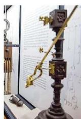
Il Museo Poleni

Ha aperto da pochi giorni la mostra temporanea "Vetro. Dall'antichità romana alle sonde spaziali", ospitata al Museo Poleni, che si trova via Loredan, presso il Dipartimento di Fisica Galileo Galilei. Protagonista assoluto della mostra è il vetro, un solido con molte proprietà di un liquido, tuttora oggetto di studi da parte degli scienziati. La mostra invita il pubblico a scoprire questo materiale, mettendone in luce le caratteristiche e alcuni impieghi nella vita quotidiana, nell'arte e nella scienza in diverse epo-